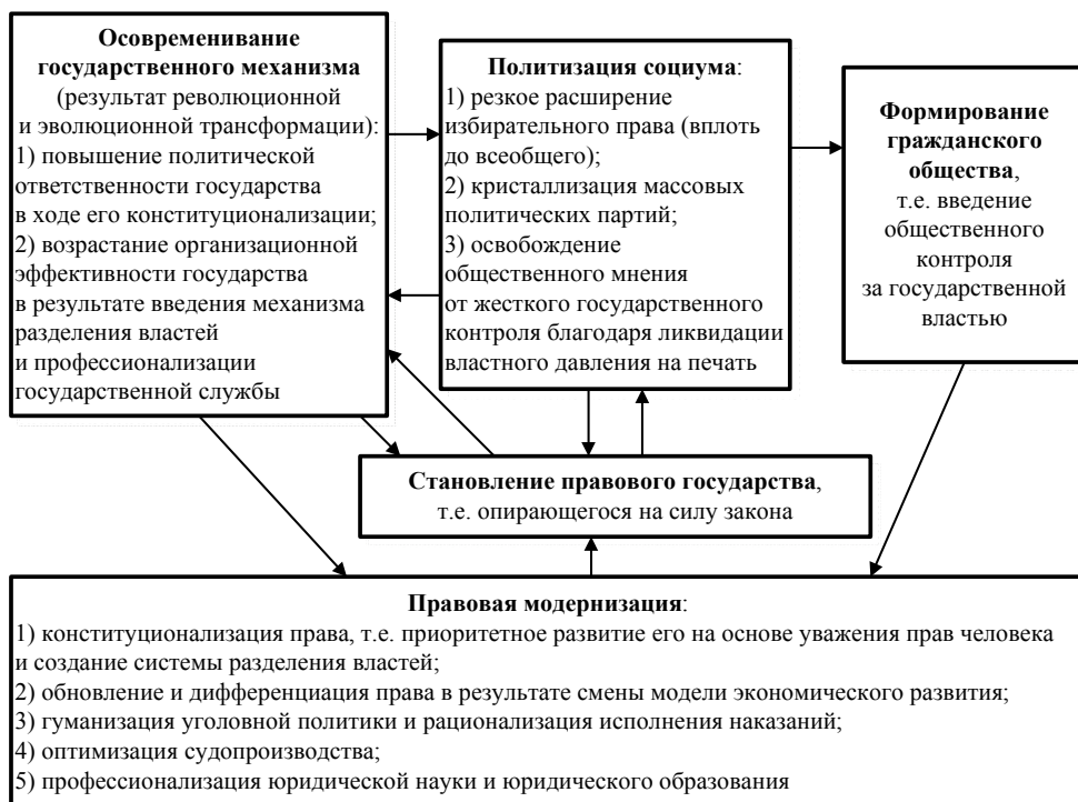
Рис. 2. Политическая модернизация

функцию политической мобилизации , т.е. активизации гражданских действий, в том числе и участия в выборах. Опять-таки в Европе, отягощенной феодально-демократическими пережитками, такая задача перед государством не стояла. Наконец, американский демократический эксперимент нуждался в кадрах должностных выборных лиц. Кадровая функция была особенно значима, ибо в США отсутствовали вековые механизмы феодально-корпоративного выдвижения государственного аппарата [2].