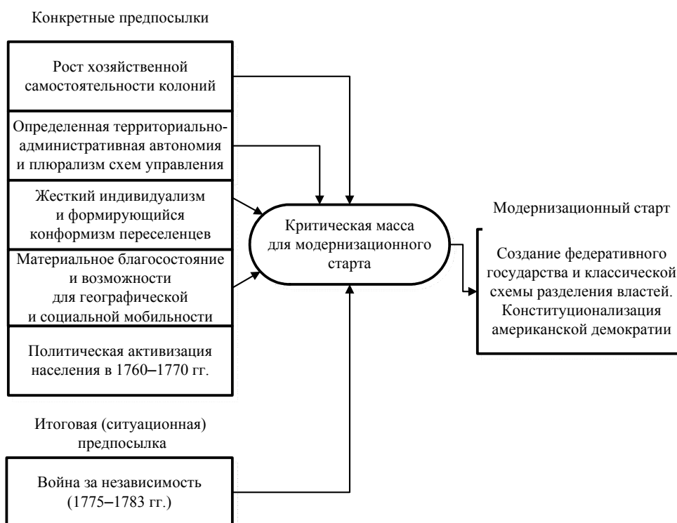
Рис. 1. Модель модернизационного старта в США (вторая половина XVIII в.)

чайно сбалансированную, продуманную модель управления. По сути дела, начало модернизации государства открывало дорогу к политической модернизации (рис. 2). Политизация социума в молодом государстве происходила стремительно.