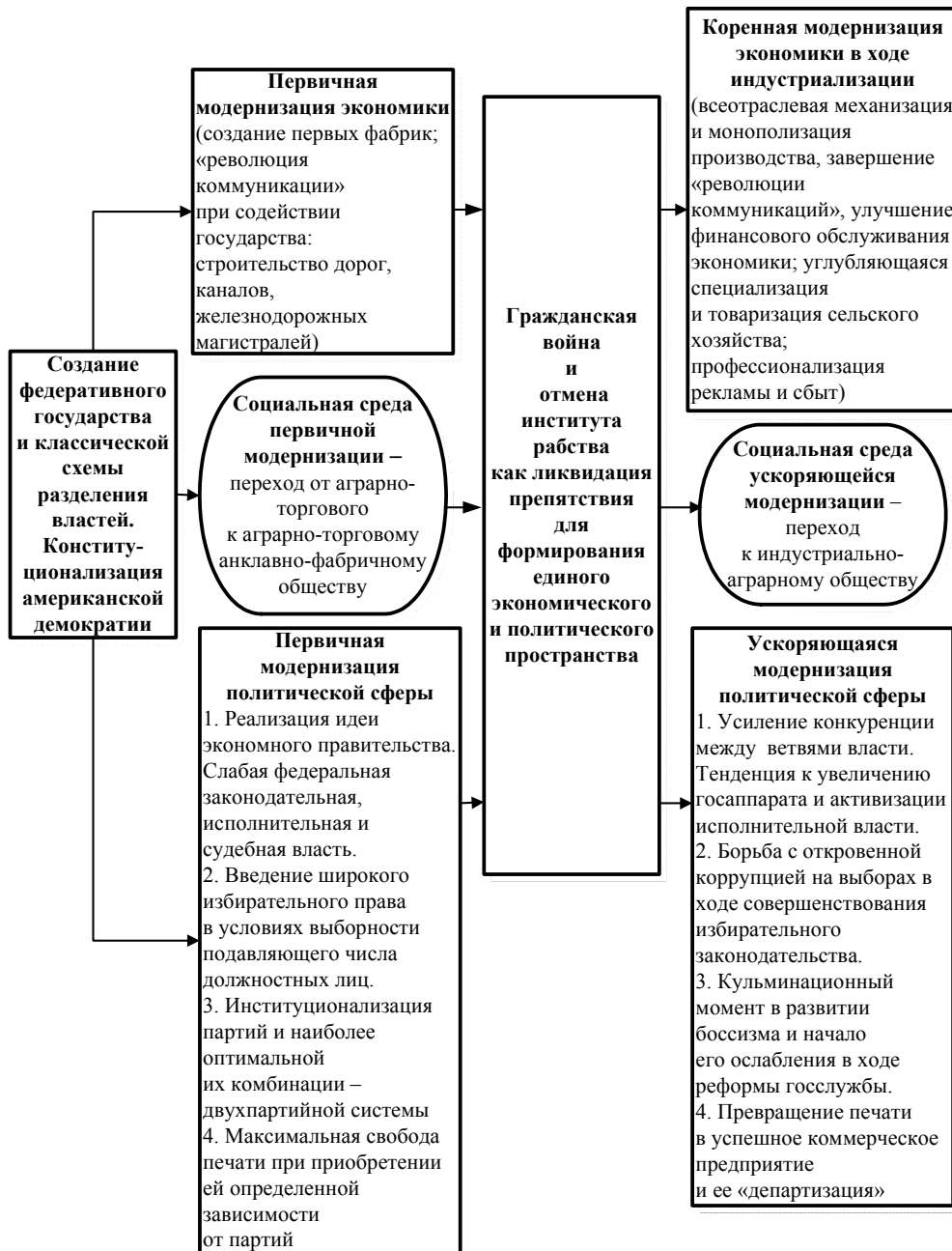
Рис. 3. Модернизационная модель США (конец XVIII – начало XX вв.)

демократами большого бизнеса вызвала острое недовольство у рядовых избирателей и создавала кризисную ситуацию для двухпартийной системы. Только своевременный маневр со стороны демократов южных и западных штатов и блокирование их с радикальной фермерской партией популистов спас положение для двухпартийного тандема. Кстати, именно в это время проявилось мощное пропагандистское воздействие американской печати, которая превратилась в крупное предприятие и, освободившись от контроля партий, не потеряла интереса к политике.